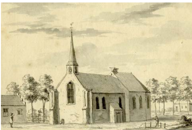
Gezicht op een onbekend kerkgebouw, ca. 1730, door tekenaar L.P. Serrurier, naar een onbekend voorbeeld uit 1669. De vermelding "de kerk van Kamerik" op de achterzijde verwijst mogelijk naar de kerk in buurtschap Teckop, bedoeld voor kerkgangers uit Kamerik en Kockengen (suggestie P. Maarleveld, mei 2008).

Een herleving van de Mariaverering in Kockengen is weliswaar uitgebleven, maar de katholieke godsdienstbeleving kwam weer tot volle bloei. In 1852 werd een