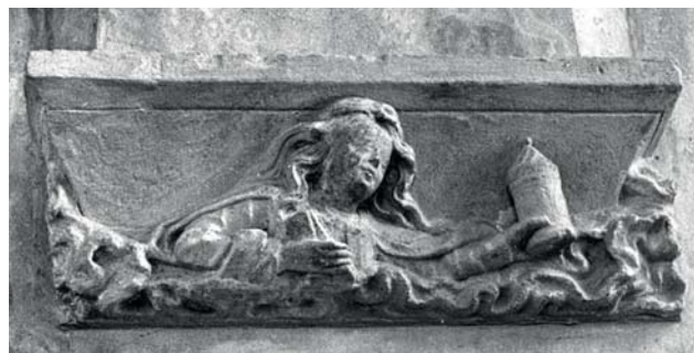
Kraagsteen in zuid-transept van de N.H. Kerk, 55 cm breed, 20 cm hoog, met een afbeelding van Maria Magdalena met de narduskruik. Nardus is de naam van een plant en van de kostbare, aangenaam geurende olie of zalf, bereid uit de wortels van deze plant.

ons bij een R.K. bedevaart voorstellen? In de katholieke traditie betreft het een reis naar een plaats waar een heilige wordt vereerd, of een plaats waar wonderbaarlijke genezingen hebben plaatsgevonden. Denk aan bekende Europese voorbeelden zoals Lourdes in Frankrijk, Kevelaar in Duitsland, Rome en Assisi in Italië, Fatima in Portugal of Santiago de Compostella in Spanje. Jaarlijks trekken er ook vele Nederlanders naar de bekende springprocessie in Echternach in Luxemburg, een pelgrimsritueel op weg naar het graf van apostel Wilibrord. Lourdes spant vanuit Nederland de kroon met enkele duizenden pelgrims per jaar. In ons eigen land is de Nationale Bedevaart naar Brielle nog steeds populair. In 1572, aan het begin van de Tachtigjarige Oorlog, werden negentien rooms-katholieke geestelijken gemarteld en vervolgens opgehangen. Dit tot stichting van de gereformeerde gelovigen uit Gorcum en de verantwoordelijke watergeuzen, de opstandige armoedzaaiers die zich achter de Prins van Oranje geschaard hadden.