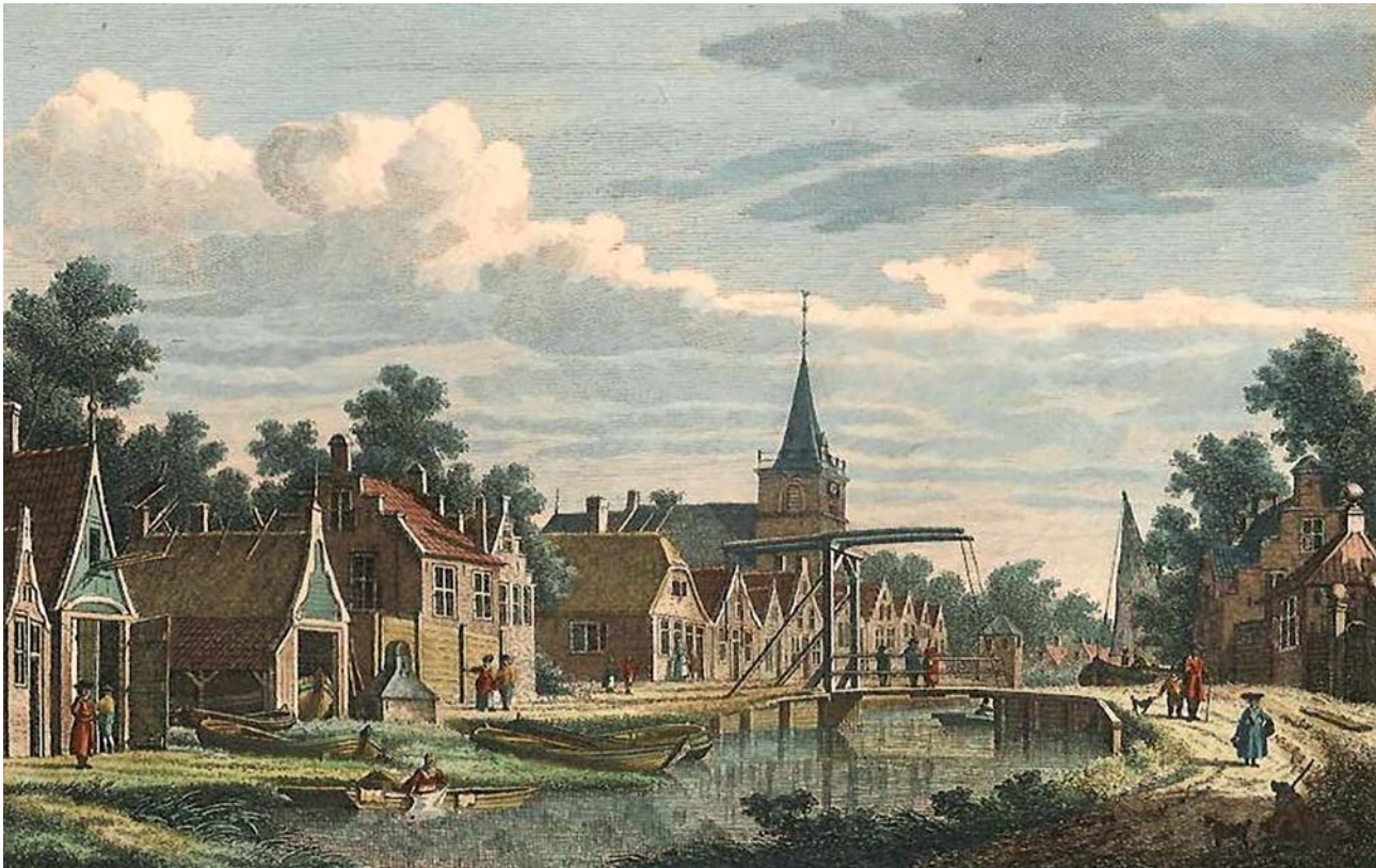
't Dorp Kockengen, 1793, kopergravure Carel Frederik Bendorp, tekening Jan Bulthuis.

door pelgrims druk bezocht bedevaartsoord. Uw hart gaat niet 'n tikkeltje sneller kloppen bij het horen van de woorden 'bedevaartsoord' of 'pelgrims'? U behoort dan hoogstwaarschijnlijk tot de generatie die zich bij die woorden niets kunnen voorstellen. Of misschien bij de wat oudere Nederlanders die het protestantse geloof aanhangen en weinig van doen hebben met dit soort van – in hun ogen – katholieke rituelen. Dat laatste is een misverstand. Pelgrimages naar een bedevaartsoord zijn niet het exclusieve domein van de roomsen. Denk maar eens aan de grote groepen moslims die tenminste eenmaal in hun leven in groten getalen naar Mekka trekken om daar de hadj in een driedaags ritueel mee te maken. Ook een vorm van pelgrimage.