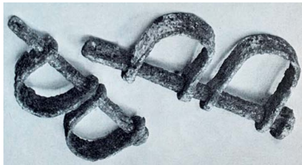
Tijdens de restauratie in de zuidelijke zijbeuk zijn diep onder de grond hand- en voetboeien gevonden.

De Reformatie van eind zestiende eeuw maakte korte metten met de roomse rituelen. De bisdommen en parochies verdwenen. Het centrale gezag van Rome trok zich terug en voor de Romeinse kerk werd Nederland